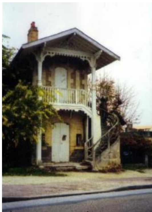
Chalet des gardiens

Le chalet des gardiens du domaine de Bellegrage a été détruit en 1996.