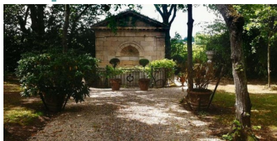
La fontaine du Pape Clément