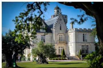
Le château Pape Clément

Le 21 septembre à 14h RV au Moulin de Noès. Le Comité de quartier du Monteil vous propose pour les journées européennes du patrimoine une conférence au Moulin de Noès d'une demi-heure ayant pour sujet le domaine de Bellevue aujourd'hui disparu et son moulin, suivie d'une balade le long du Peugue, vers le Madran et le domaine forestier en passant devant le Château de Haut Brana, une visite des jardins du Château Pape Clément et sa croix de Mission puis un retour le long des vignes et le Château de Madran pour finir par le bois de Bernis. Le Peugue est le plus long et important des ruisseaux de Pessac de 13,5 km de long. 3 siècles avant notre ère, la peuplade Biturige Vivisque s'installe au bord du delta formé par le Peugue et la Devèze. Ils formaient un delta marécageux qui fut creusé par les Romains au Ier siècle apr. J.-C., pour en faire un port de la ville de Burdigala. Un important marché se développe à l'extérieur des remparts. Il est appelé le port des Pèlerins au Moyen Age. Un grand nombre de moulins aimaient son cours dont celui de Noès du domaine de Bellevue, de nombreuses activités rappelées par le nom des rues :des Lavandières, des Cressonnères, du Vivier. Le Madran est un affluent du Peugue. Il s'y jette près du lieu du moulin d'Ar-lac aujourd'hui disparu. Il prend sa source dans