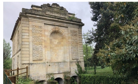
Le moulin de Noès

Le 21 septembre à 14h RV au Moulin de Noès. Le Comité de quartier du Monteil vous propose pour les journées européennes du patrimoine une conférence au Moulin de Noès d'une demi-heure ayant pour sujet le domaine de Bellevue aujourd'hui disparu et son moulin, suivie d'une balade le long du Peugue, vers le Madran et le domaine forestier en passant devant le Château de Haut Brana, une visite des jardins du Château Pape Clément et sa croix de Mission puis un retour le long des vignes et le Château de Madran pour finir par le bois de Bernis. Le Peugue est le plus long et important des ruisseaux de Pessac de 13,5 km de long. 3 siècles avant notre ère, la peuplade Biturige Vivisque s'installe au bord du delta formé par le Peugue et la Devèze. Ils formaient un delta marécageux qui fut creusé par les Romains au Ier siècle apr. J.-C., pour en faire un port de la ville de Burdigala. Un important marché se développe à l'extérieur des remparts. Il est appelé le port des Pèlerins au Moyen Age. Un grand nombre de moulins aimaient son cours dont celui de Noès du domaine de Bellevue, de nombreuses activités rappelées par le nom des rues :des Lavandières, des Cressonnères, du Vivier. Le Madran est un affluent du Peugue. Il s'y jette près du lieu du moulin d'Ar-lac aujourd'hui disparu. Il prend sa source dans