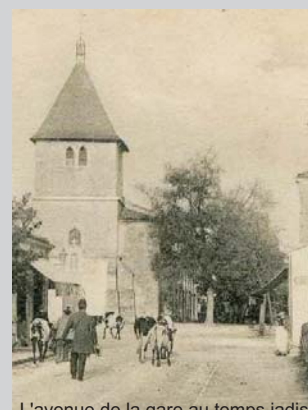
L'avenue de la gare au temps jadis

Nous vous l'avions déjà annoncé dans les derniers V&V, le comité s'engage dans une action de collecte de témoignages des anciens de notre quartier. Nous souhaitons ainsi tenter de reconstruire le passé qui fut celui des lieux que nous occupons aujourd'hui. Nous viendrons donc sonner à vos portes, chers anciens, pour collecter vos récits des événements ou aménagements ayant marqué le quartier. Vos anecdotes et images seront aussi les bienvenus. Pour ceux qui participerons au repas d'automne, n'hésitez pas à vous manifester, dès ce jour-là, auprès des membres du comité.