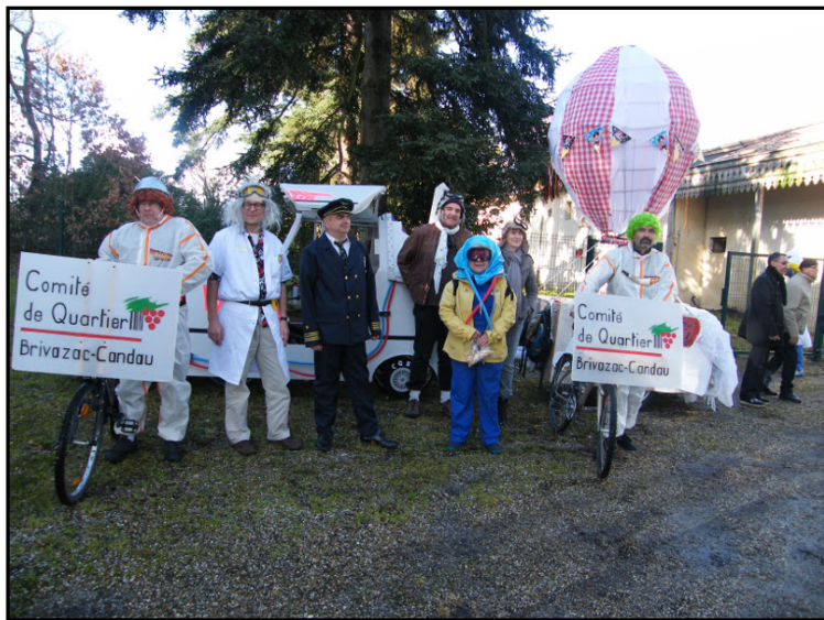
Le char de cette année dans le parc de Camponac après le défilé et une partie de l'équipe qui a rendu possible cette réalisation.

Au comité, nous avons rejoint le mouvement du carnaval parce que nous considérons que c'est une fête pour les enfants. Cette année, en l'état actuel des modalités d'organisation, le comité de quartier ne s'associera pas à cet événement en raison des risques encourus par les enfants qui déambuleraient près des chars dans la pénombre. Nous regrettons ce choix et comptons sur une inflexion de cette décision unilatérale.