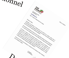
Des courriers à destination de la mairie