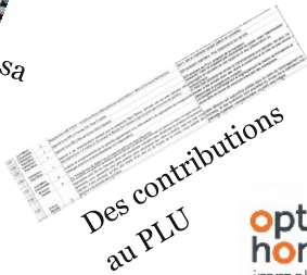
Des contributions au PLU