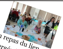
Un repas du lien intergénérationnel