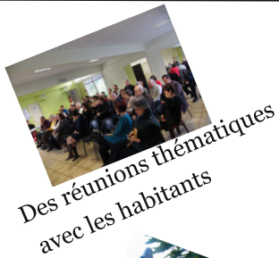
Des réunions thématiques avec les habitants