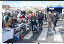
Notre vide-greniers gratuit pour les habitants du quartier