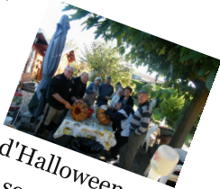
La fête d'Halloween avec sa soupe et ses châtaignes