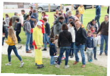
La chasse aux oeufs pour Pâques