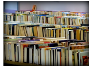
La bourse aux livres