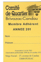
La campagne d'adhésion