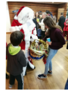
L'arbre de Noël et ses réjouissances